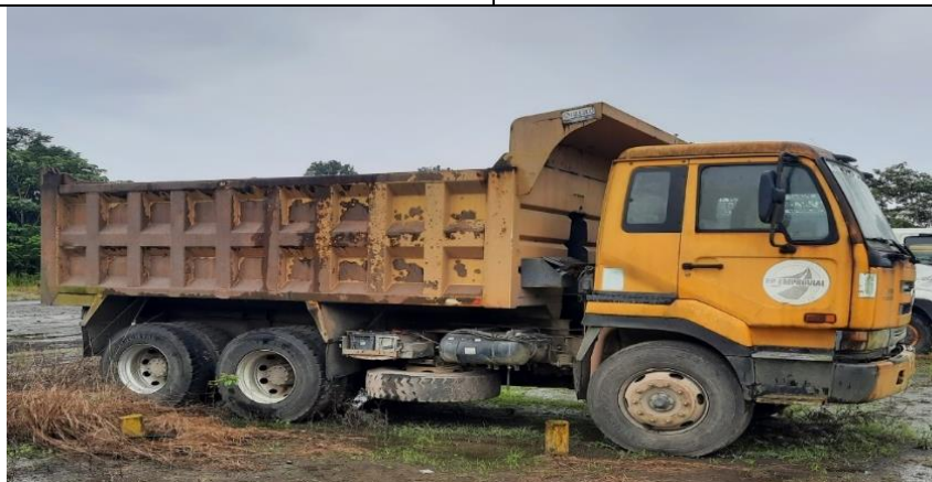
VISTA LATERAL DERECHA