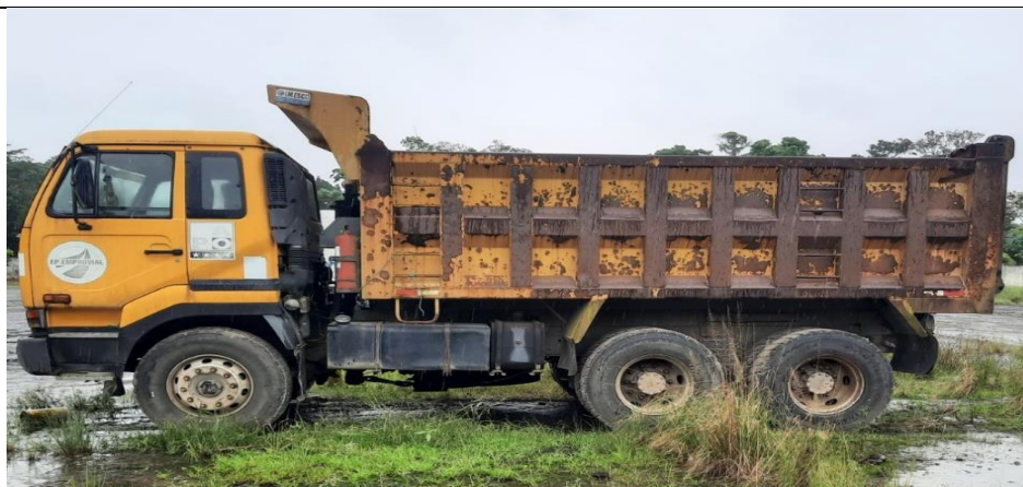
VISTA LATERAL IZQUIERDA